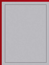
PÁGINA 330 mm x 240 mm